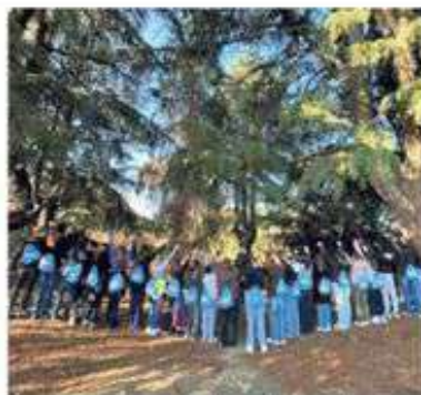
Gli studenti del progetto Erasmus hanno visitato il Biellese

Sanuario di Oropa, il Ricetto di Candelo, il centro di Biella e l'Oasi Zegna, ma anche il caseificio Rosso e il paese di Cavaglià sono state le mete delle gite. «Abbiamo mostrato ai nostri ospiti quello che ci circonda e che, per molti aspetti, ci accomuna a diverse delle realtà ospitate», prosegue la dirigente responsabile dello scambio. «Ci sono stati anche diversi momenti in classe fatti di giochi e attività per conoscersi meglio e mettere in campo