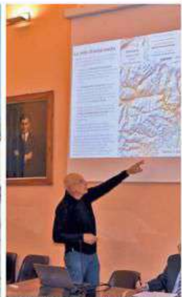
La novità del Cammino di Oropa finanziata con 147 mila euro della fondazione Compagnia di San Paolo sarà stata illustrata ieri a Droppa

91 i beni culturali che vengono toccati dal tracciato