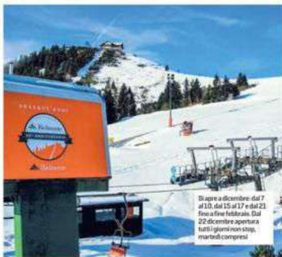
Si apre a dicembre: dal 7 al 10, dal 15 al 17 e dal 21 fino a fine febbraio. Dal 22 dicembre apertura tutti i giorni non stop, martedì compresi

consentito di potenziare i collegamenti tra tre Sacri Monti - ha aggiunto Francesca Giordano, presidente dell'Ente di gestione dei Sacri Monti - L'obiettivo di aumentare i tempi di permanenza di pellegrini e visitatori è stato centrato».