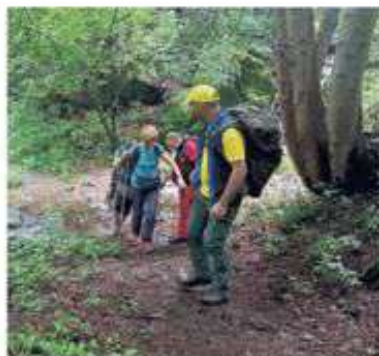
Alle passeggiate partecipano molti residenti delle città del Nord

Centro sportivo-educativo nazionale con una specializzazione in «Forest bathing», pratica che consiste in passeggiate all'aria aperta e ripetute in giorni consecutivi. «Un uso consapevole di questo spazio passa anche tramite l'accoglienza e il benessere che il bosco può dare», spiega De Luca. «Noi organizziamo passeggiate e attività a contatto con la natura. Durante le nostre giornate individualiamo spazi dove ci